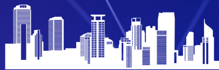
商業大樓、企業總部